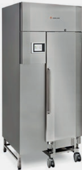
STORM 960 SNABBNEDKYLNINGSSKÅP ROLL-IN